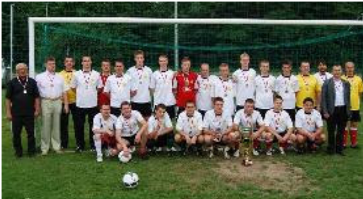
Drużyna GROM Malanów

W piątek 25 czerwca 2010 r. na boisku gminnym odbyło się podsumowanie sezonu piłkarskiego 2009/2010. Uroczystość rozpoczęła ceremonia wręczenia zawodnikom i trenerom Klubu Sportowego Grom Malanów okazałego pucharu oraz medali upamiętniających zdobycie I miejsca w rozgrywkach klasy B OZPN Konin w zakończonym właśnie sezonie.