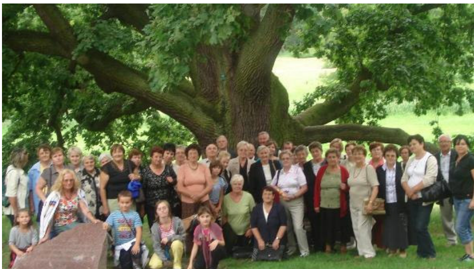
Wspólne zdjęcie w gołuchowskim parku

Następnie zwiedzaliśmy zamek w Gołuchowie, który położony jest w 162 hektarowym parku. Zamek miał wielu właścicieli, ale ostatnią była Izabela z Czartoryskich Działyńska, która tu właśnie umieściła swoją kolekcję dzieł sztuki, przez co zamek stał się