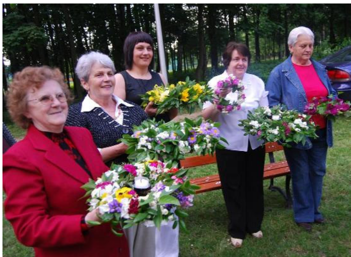
Panie z dumą prezentowały wianki świętojańskie