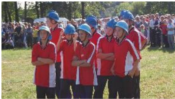
Chłopięca drużyna z Kotwasic

Z kolei w kategorii drużyn żeńskich w grupie „C” (KDP) zgłosiła się tylko jedna drużyna z jednostki OSP Bibianna, która ukończyła konkurencję z wynikiem - 144,3 pkt.