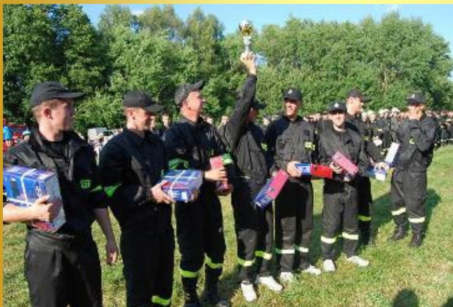
Zwycięzcy zawodów drużyna OSP Grąbków