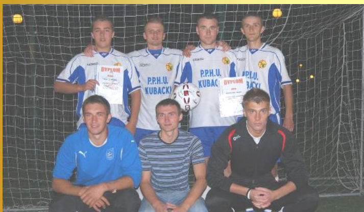
Zwycięzcy rozgrywek ligowych – GROM Malanów

ed. ze str. 11 W meczu finałowym, kończącym tegoroczny sezon zmierzyli się tryumfatorzy obu grup – Grom Malanów I oraz FC Wembley Uniejów . Zwycięsko z tego pojedynku wyszła drużyna z Malanowa pokonując rywala 6:4.