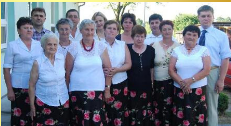
cd. str. 9 Jarzębinki wraz z zaproszonymi gośćmi