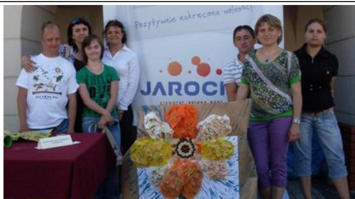
Przeglądzie Twórczości Osób Niepełnosprawnych

Był to VII Przegląd Twórczości Osób Niepełnosprawnych, którego celem była integracja osób niepełnosprawnych ze społecznością. W trakcie imprezy wszystkie zaproszone ośrodki mogły zaprezentować swój dorobek artystyczny. Spotkanie umożliwiło uczestnikom i opiekunom zawrzeć nowe znajomości i wymienić się swoimi doświadczeniami poprzez zaobserwowanie nowych technik i form artystycznych stosowanych w pracy terapeutycznej. Głównym punktem imprezy były warsztaty plastyczne, podczas których każdy z ośrodków miał za zadanie wykonać z otrzymanych materiałów „Coś z niczego”. Wszystkie