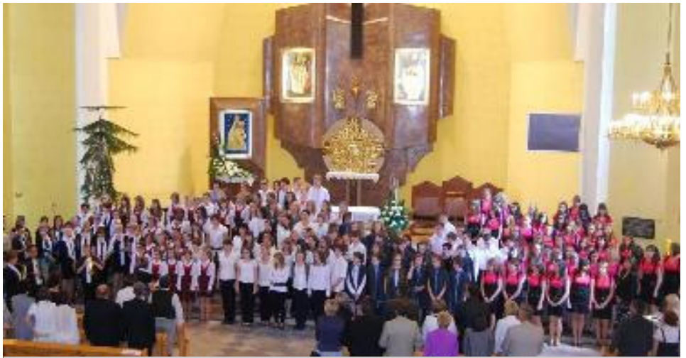
Chóry biorące udział w przeglądzie

Kilkunastoosobowe zespoły prezentowały po trzy utwory. Przed