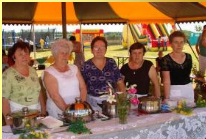
Mistrzynie kuchni w konkursie

Po degustacji apetycznie zaprezentowanych potraw jury postanowiło przyznać trzy równorzędne wyróżnienia dla sołectw: Czachulec, Feliksów i Poroże , a nagrodę