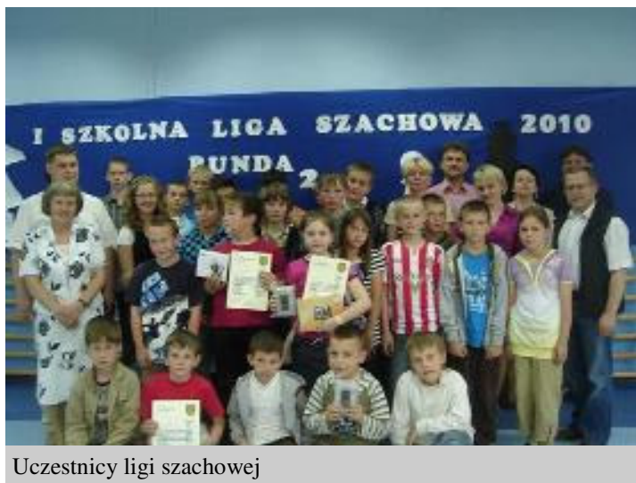
Uczestnicy ligi szachowej

W dniu 21 czerwca 2010 r. w Szkole Podstawowej w Miłaczewie odbyła się kolejna runda rozgrywek Szkolnej Ligi Szachowej. Runda ta zakończyła roczne rozgrywki szachowe i wyłoniła zwycięzców.