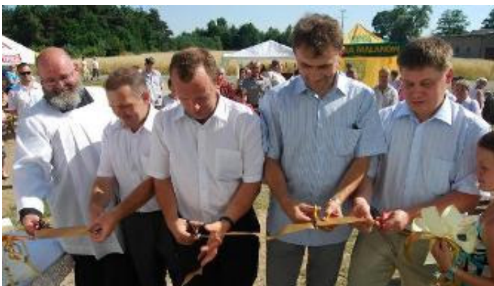
Podczas festynu dokonano otwarcia wiejskiej świetlicy

S towarzyszenie Mieszkańców dla Rozwoju Wsi Poroże już po raz czwarty zorganizowało Festyn Rodzinny.